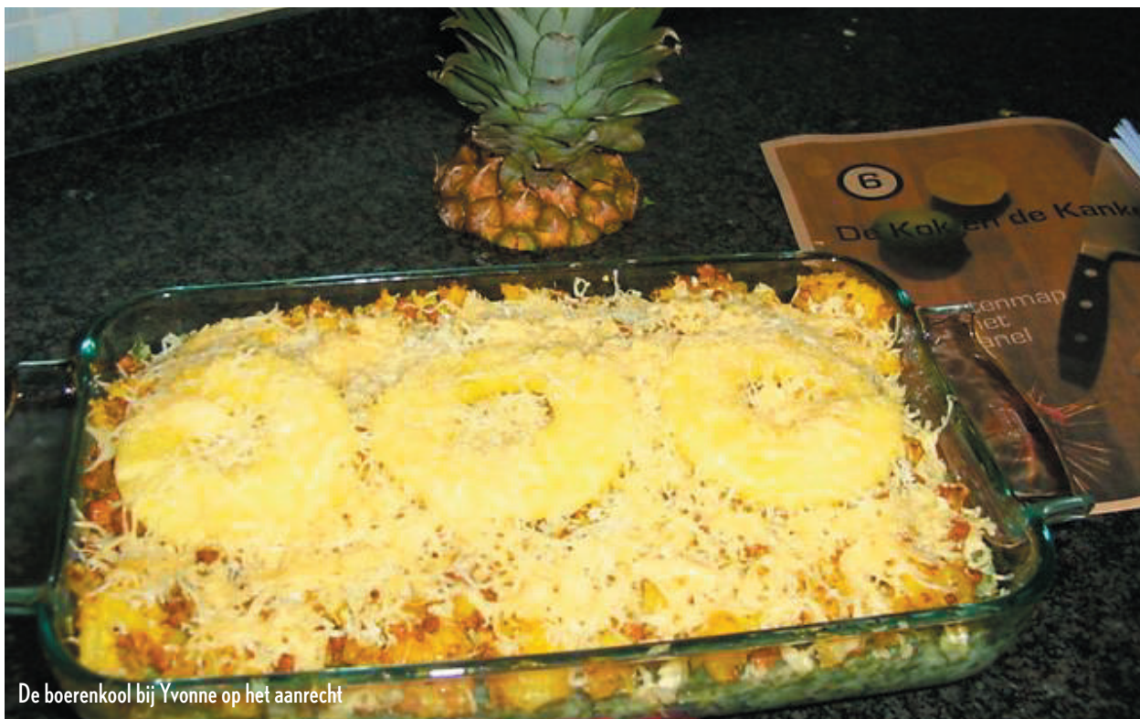
De boerenkool bij Yvonne op het aanrecht