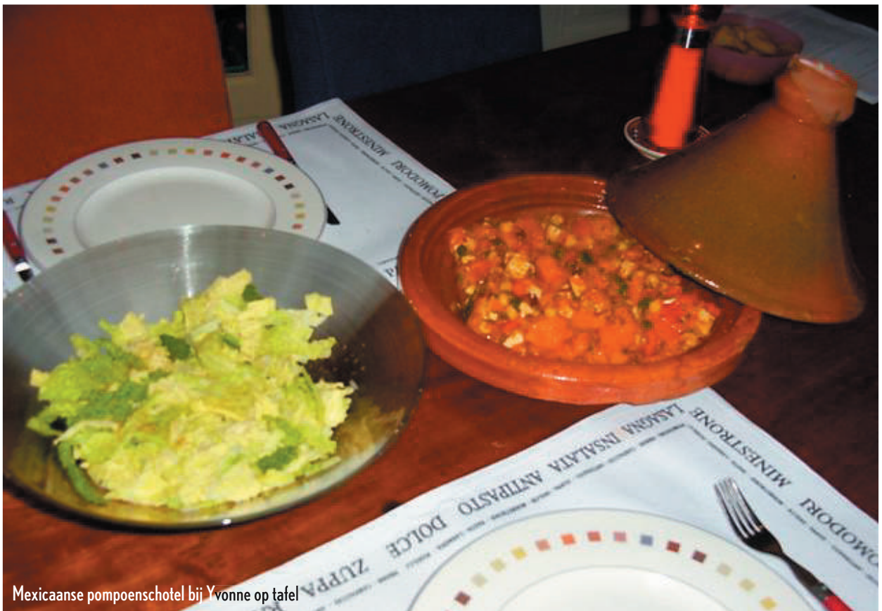
Mexicaanse pompoenschotel bij Yvonne op tafel