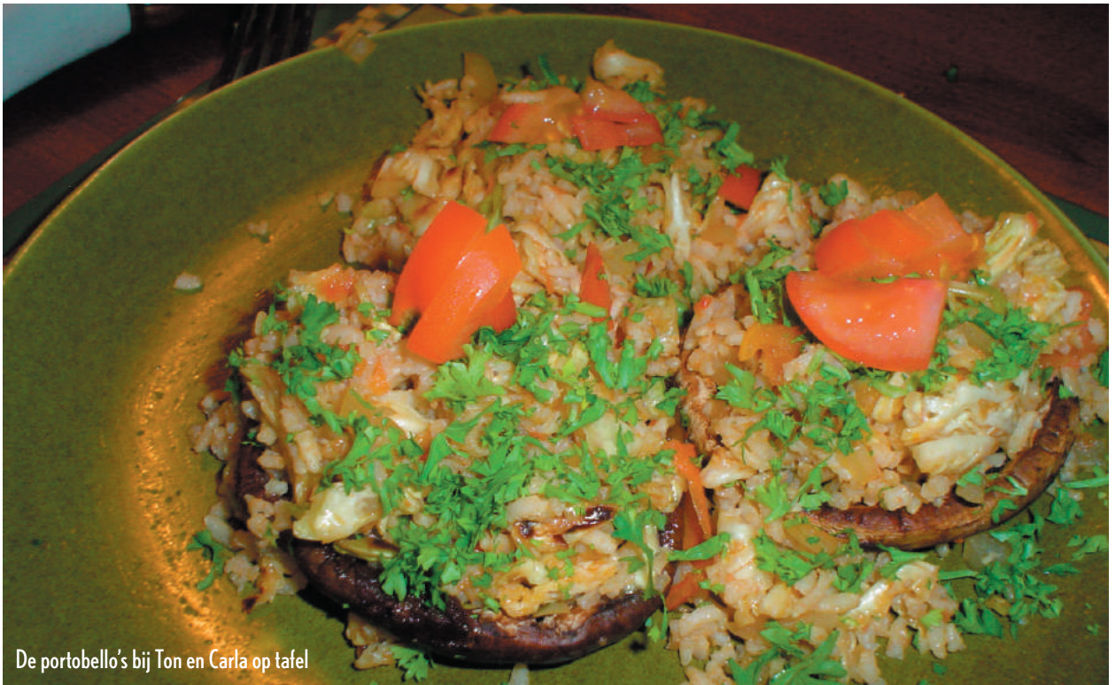
De portobello's bij Ton en Carla op tafel