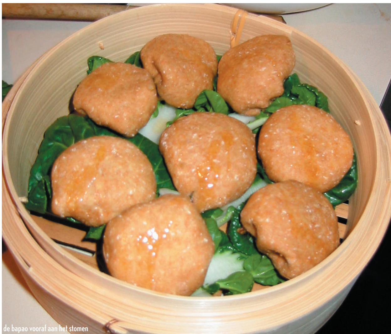
de bapao vooraf aan het stomen