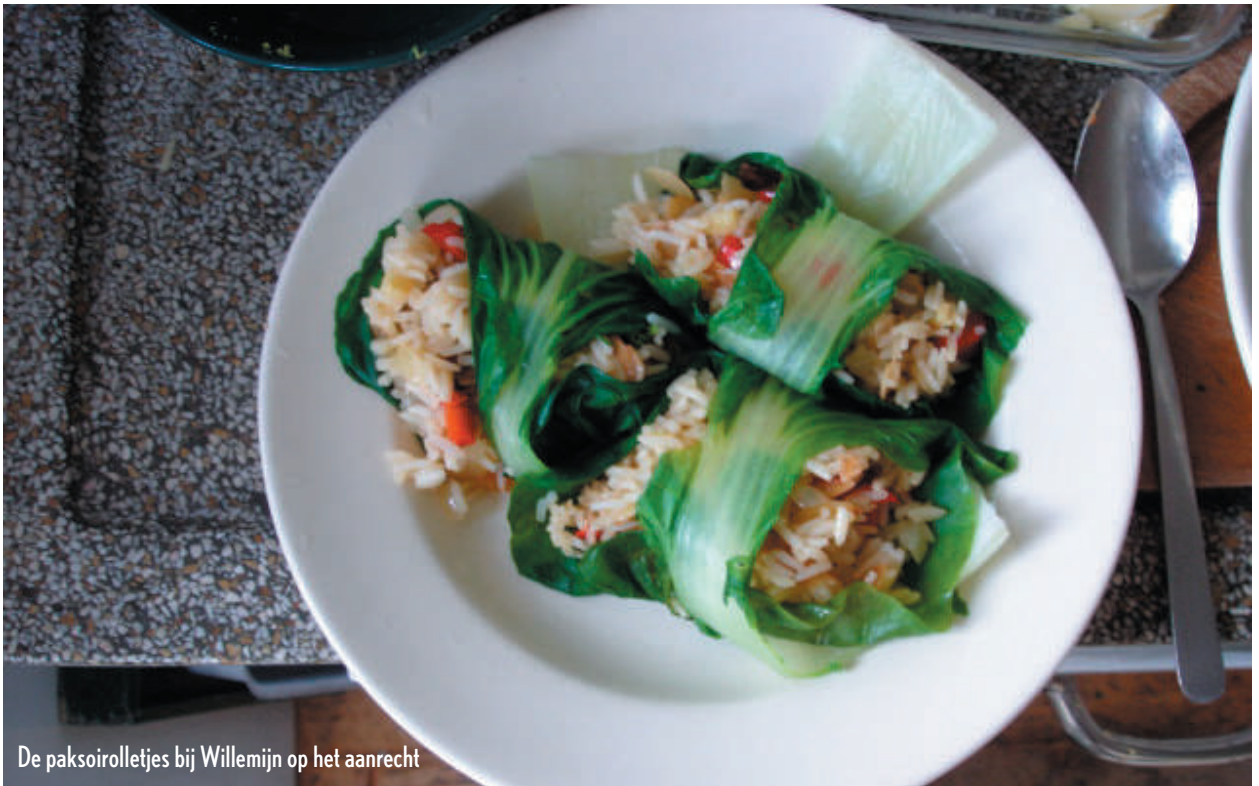
De paksoirolletjes bij Willemijn op het aanrecht