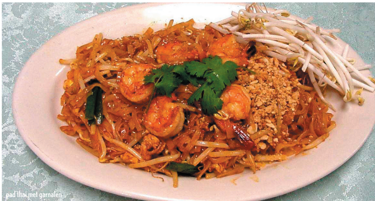
pad thai met garnalen