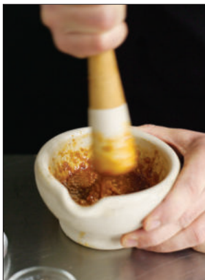
1. Stamp de smaakmakers fijn in een vijzel.