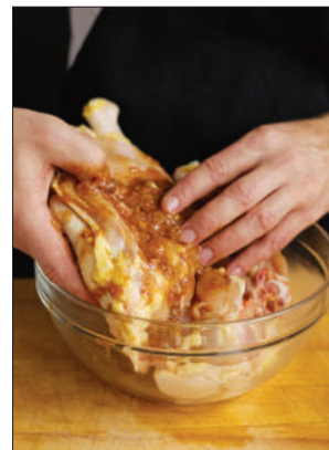
3. Verdeel de marinade erover en laat de kip 1-4 uur marinieren. Hoe langer ze in de marinade ligt, hoe intenser de smaak wordt.