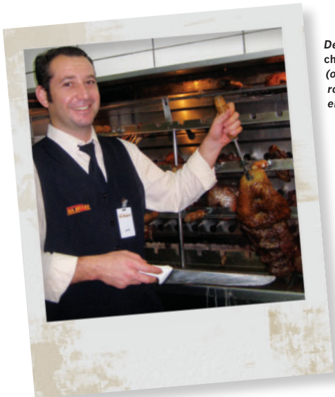
Deze Braziliaanse churrasqueiro (ober-grillmeester) roostert het vlees en dient het op.

Italiaanse aan het spit geroosterde ossenhaas: rijg de ossenhaas aan het spit, bestrijk hem met olijfolie en bestrooi hem met zout en gekneusde peperkorrels, net als in stap 3. Bestrooi hem dan met 3 fijngesneden teentjes knoflook en 3 eetlepels gehakte verse rozemarijn of salie (of een mix). Sprenkel er nog wat olie over en druk de smaakmakers goed tegen het vlees. Rooster de ossenhaas zoals in stap 4. Besprenkel het vlees na het snijden met wat extra vergine olijfolie. Benissimo!