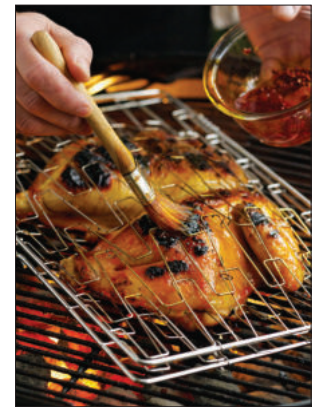
4. Bestrijk de kip tijdens het grillen met de annatto-olie; die geeft kleur, glans en smaak.