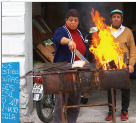
Een straatverkoper in Uruguay grilt worst op een 'mobiele' barbecue.

HET OPMERKELIJKSTE GERECHT OP HET MENU: choto , gegrilde lamsdarmen (ze smaken beter dan de naam doet vermoeden).