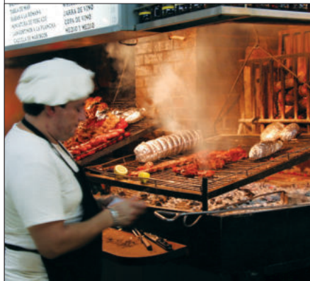
Een grill in het barbecuecentrum van Uruguay, de Mercado del Puerto (havenmarkt) in Montevideo. Het rooster loopt schuin omhoog voor verschillende grilltemperaturen.

DE SMAKEN: in Uruguay worden weinig speciale specerijen of marinades gebruikt. Zout is de voornaamste smaakmaker, vaak in grote hoeveelheden.