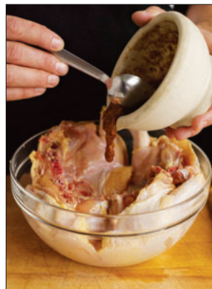
2. Giet de marinade over de kip.