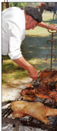
Gaucha-barbecue op een ranch in Uruguay.

In Uruguay duurt een typische barbecue bijna een hele middag. Je begint met gegrilde kaas, plakken provoleta die rechtstreeks op het rooster worden gebakken tot ze smelten en borrelen; en daarna