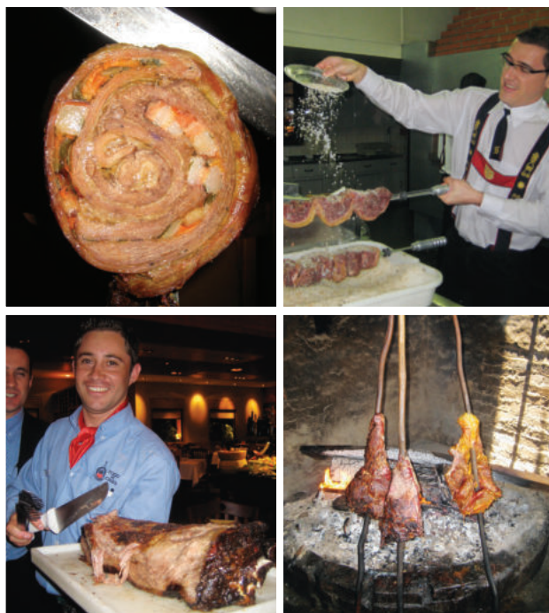
MET DE KLOK MEE VANAF LINKSBOVEN: matambre (opgerolde, gevulde vanglap) staat klaar om gesneden te worden; een Braziliaanse picanha (bovenstuk van de varkenslende) wordt bestrooid met zout; mamona (Colombiaans kalfsvlees) aan stokken naast een eucalyptusvuur; het grootste runderribstuk van de wereld wordt gebraden boven een fogo de chão (kampvuur).

In dit hoofdstuk staat voor iedere vleesliefhebber wat lekkers - of je nu houdt van grote, rokerige lappen vlees of kleine spiesjes, van gegrilde of aan het spit geroosterd steaks of van vlees dat net als in de oertijd in de sintels is geroosterd.