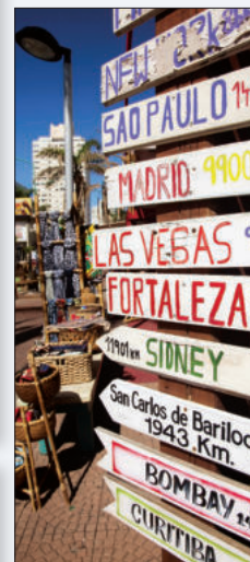
Wegwijzers in Punta del Este. In Uruguay leiden alle wegen naar een barbecue.

U ruguay kan prima opboksen tegen de twee barbecuegrootheden aan weerszijden: Argentinië en Brazilië.