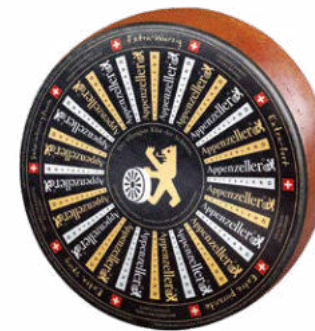
Extra-Würzig Extra-pittig Rijping : min 6 maanden