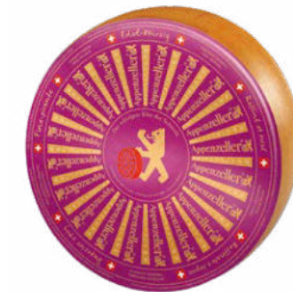
Edel-Würzig Verfijnd-pittig Rijping : 9 maanden