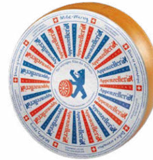
Mild-Würzig Zacht en aromatisch Rijping : 3 maanden

Natuurlijk moet de natuur ook een handje geholpen worden om een echte unieke kaas te produceren. Ook expertise en vakmanschap zijn dus erg belangrijk in dit proces. In het strikt afgebakende en beschermde productiegebied, de kantons Appenzell Innerrhoden, Appenzell Ausserrhoden en in bepaalde delen van de kantons St. Gallen en Thurgau, wordt de traditie naarstig in leven gehouden. Het 700 jaar oude recept is heilig. En zo ook de zogenaamde 'Kräutersulz', een kruidenmengsel waarvan de samenstelling nog steeds een streng bewaard geheim is. Al deze ingrediënten samen vormen het recept van deze grootse kaassoort.