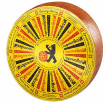
Kräftig-Würzig Krachtig-pittig Rijping : 4 tot 6 maanden